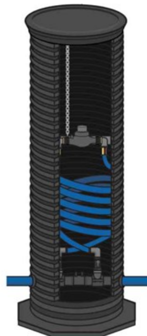
Figur 3 Exempel på installation av vattenmätare i brunn då inomhusinstallation ej är möjligt.

När vattenmätarkonsol är monterad kontaktas vattenmätartekniker, på tel 0704 826 938 telefontid 08.00-15.00, för inbokning av tid för uppsättning av vattenmätare och öppning av servisventil.