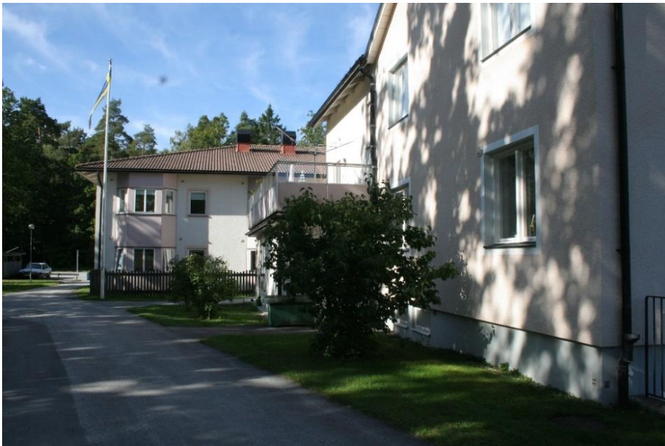
Syréngården i Roma är först ut att prova mobil dokumentation

I början av 2021 kommer vi påbörja en pilot för införande av mobila appar för dokumentation i Treserva. Olika enheter inom hemtjänst, hemsjukvård, säbo och OoF kommer få agera piloter. Syréngården kommer vara det boende som först får prova detta inom säbo. Där kommer det finnas plattor på brukarnas rum med Treserva som app.