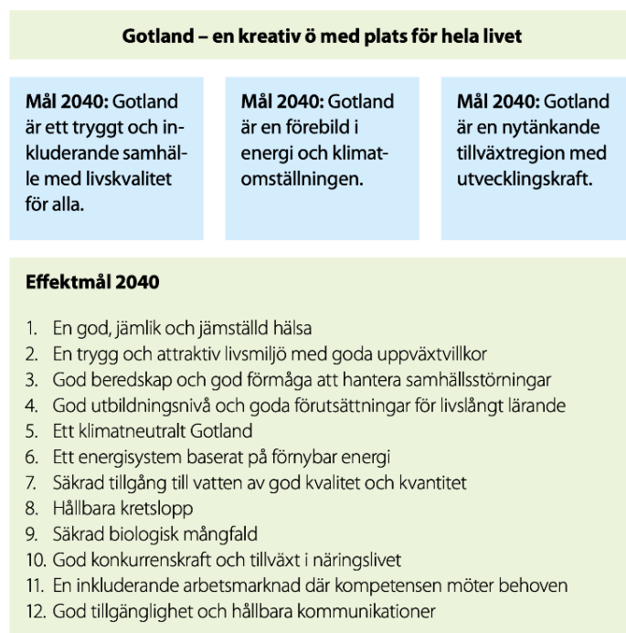
Figur 1. Vision, övergripande mål och effektmål från Vårt Gotland 2040 .

Vårt Gotland 2040 är en regional utvecklingsstrategi (RUS) för en långsiktig hållbar utveckling för Gotland. Den antogs av regionfullmäktige i februari 2021. Vårt Gotland 2040 syftar till bästa möjliga framtid för oss som bor och verkar på Gotland och för alla som besöker vår ö. Strategin består av en vision, tre övergripande mål och tolv effektmål (Figur 1) och bygger på Agenda 2030. 1