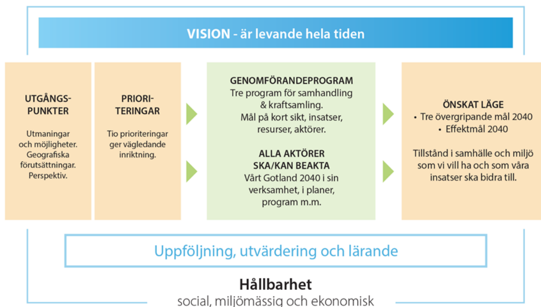
Figur 8. Upplägg regionala utvecklingsstrategin (RUS) Vårt Gotland 2040 .

I Vårt Gotland 2040 finns de långsiktiga målen för en hållbar regional utveckling på Gotland. Det är i Vårt Gotland 2040 som de tre genomförandeprogrammen tar avstamp för att skapa en gemensam kraftsamling för att nå önskat läge och mål till 2040 (Figur 8).