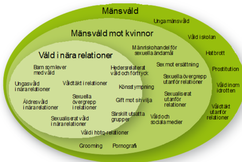
Figur 6. Bilden illustrerar att mäns våld mot kvinnor och våld i nära relationer kan inrymma flera aspekter av våld.

En förutsättning för en trygg uppväxt fri från våld är att ingen ska utsättas för eller bevittna våld i hemmet. För att det ska bli möjligt behövs en ökad medvetenhet om mäns våld mot kvinnor. Men det behövs också en fokusflyttning, från privat angelägenhet till allas angelägenhet. Våld kan se ut på olika sätt, såsom fysiskt, psykiskt, sexuellt, materiellt, ekonomiskt, latent, 46 försummelse, hedersrelaterat, vanvård samt våld relaterat till funktionsnedsättning. Specifika insatser kan behöva riktas mot olika grupper exempelvis barn, nyanlända, unga kvinnor, unga män, äldre eller grupper med annan utsatthet.