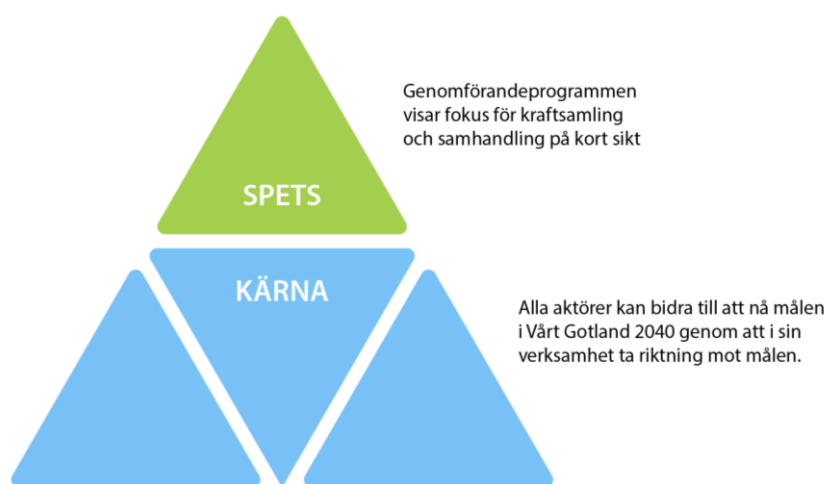
Figur 9. Illustration som visar att genomförandeprogrammen utgör spetsen för kraftsamling och samhandling på kort sikt.

Det innebär att genomförandeprogrammen har fokus på samhandling kring prioriterade mål och insatsområden. Det vill säga, spetsen ska bidra till ett starkt mervärde genom att åstadkomma en förändring som inte varit möjlig utan de val och prioriteringar som genomförs gemensamt mellan aktörerna (Figur 9). Genomförandeprogrammen innehåller inte allt som görs för att röra sig i önskad riktning mot målen till 2040. Utöver det kan olika aktörer i sin egen verksamhet bidra till att nå målen i Vårt Gotland 2040 .