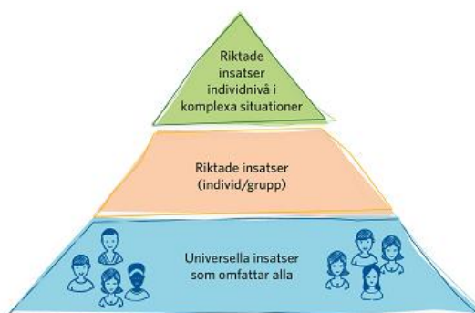
Figur 4. Preventionstriangeln visar hur aktiviteter kan sättas in på olika nivåer för att skapa förflyttning mot målen. 8

Ett prioriterat insatsområde kan innefatta olika typer av aktiviteter. Aktiviteterna kan riktas mot enskilda individer, grupper eller till hela Gotlands befolkning utifrån preventionstriangelns tre nivåer (Figur 4). För att lyckas med en förflyttning mot målen behövs oftast aktiviteter på fler nivåer. För varje prioriterat insatsområde nämns exempel på möjliga aktiviteter. Dessa ska endast ses som exempel för ökad förståelse och många fler aktiviteter kan skapas inom de olika områdena.