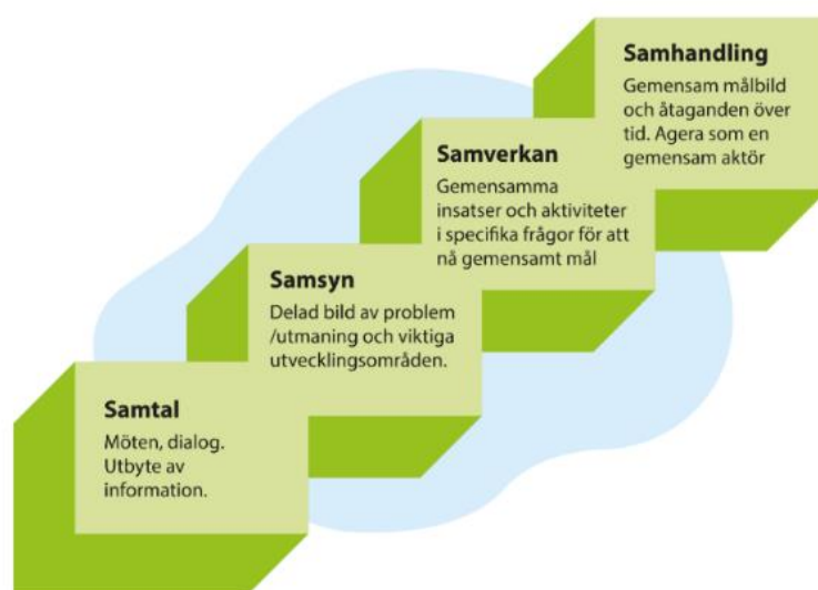
Figur 2. Samverkanstrappan. Syftet med genomförandeprogrammet är att skapa samverkan och samhandling kring gemensamma mål där vi kan kraftsamla tillsammans.

Programmet har tagits fram gemensamt med flera aktörer på ön (bilaga 6.1). Det riktar sig till alla verksamheter och aktörer som vill samverka och bidra till ett hållbart Gotland. Region Gotland har det så kallade regionala utvecklingsansvaret och ansvarar för samordning inom programmet. Ansvar för genomförandet av aktiviteter för att nå målen bärs av alla aktörer gemensamt.