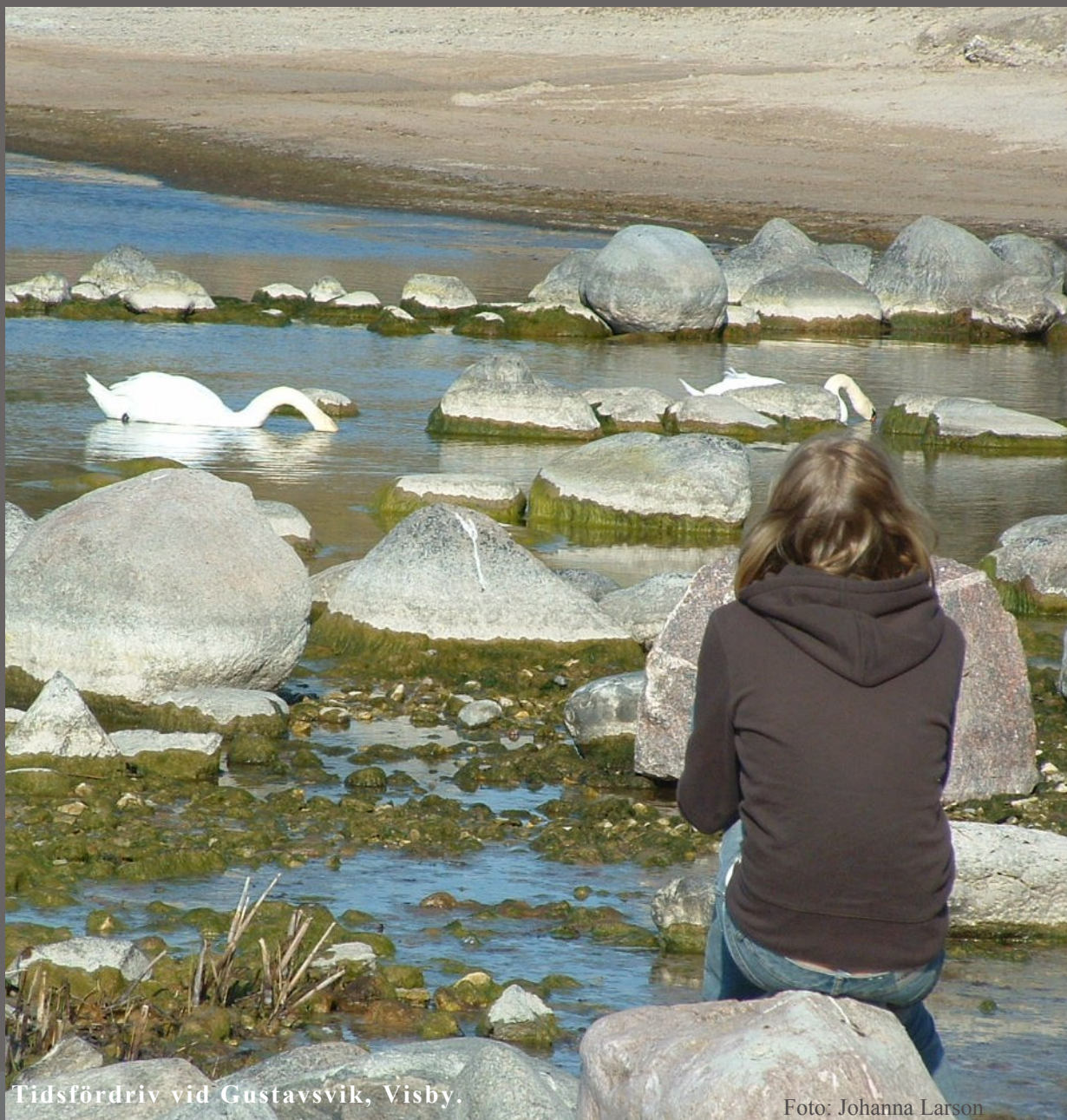
Tidsfördriv vid Gustavsvik, Visby.