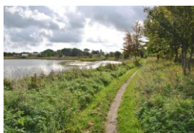
Figur 3 Järnvägsbanken.