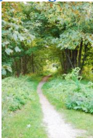
Figur 2 Järnvägsbanken.