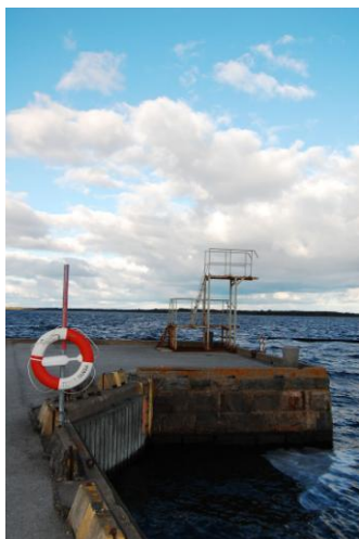
Figur 4 Hopptornet i hamnen, många av de intervjuade barnens favoritplats.