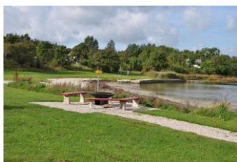
Figur 5 Badstranden