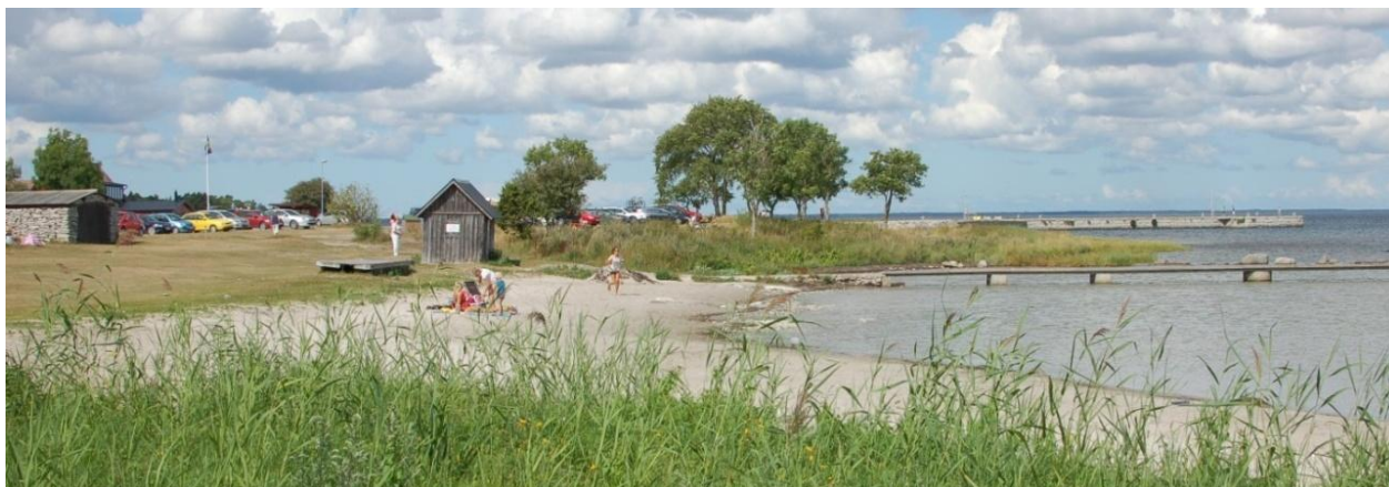
Bild: Badplatsen i Katthammarsvik dit många boende och besökare kommer för att bada, sola och ha picknick.