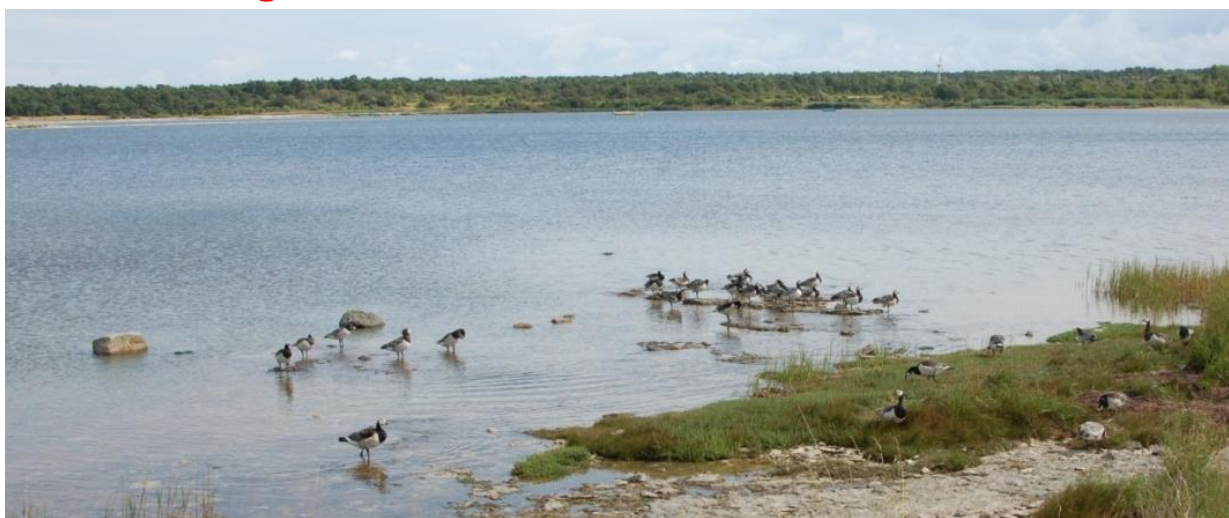
Bild: Vy från piren mot Hammaren och Grogarnsberget.