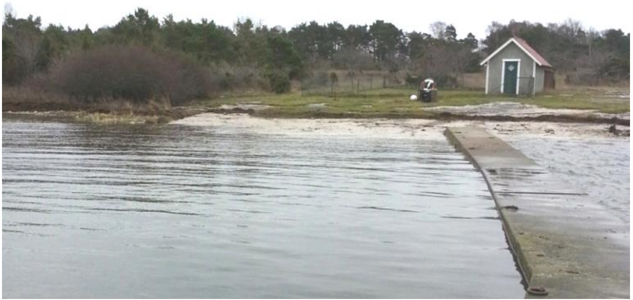
Bild: Vy in mot stranden vid Redners brygga. En lite mindre välkänd strand i Katthammarsvik.