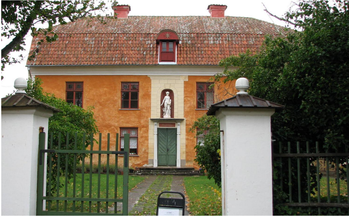
Bild: Katthamra Gårds huvudbyggnad.