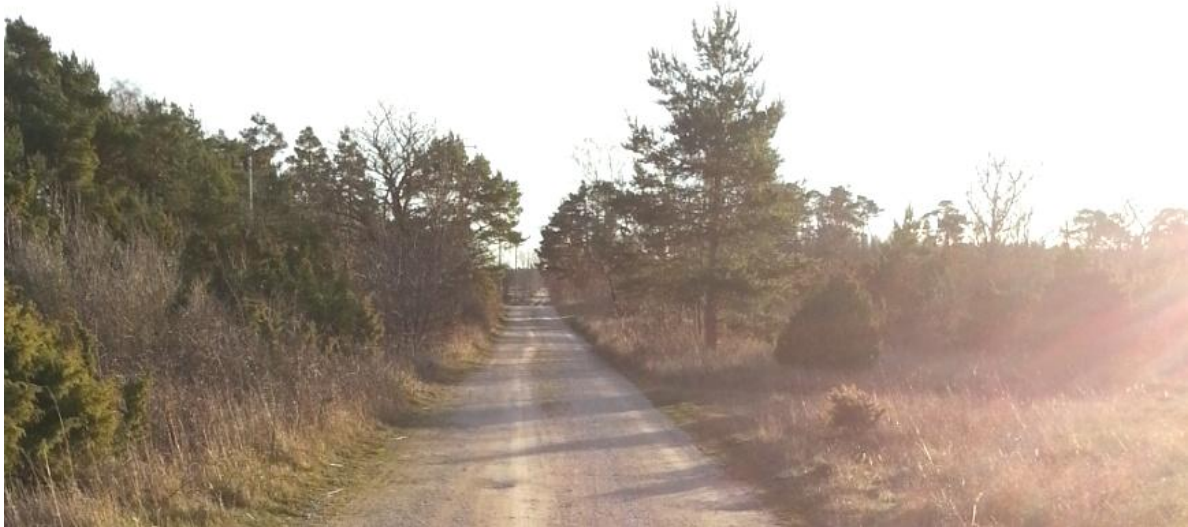
Bild: länsväg 631