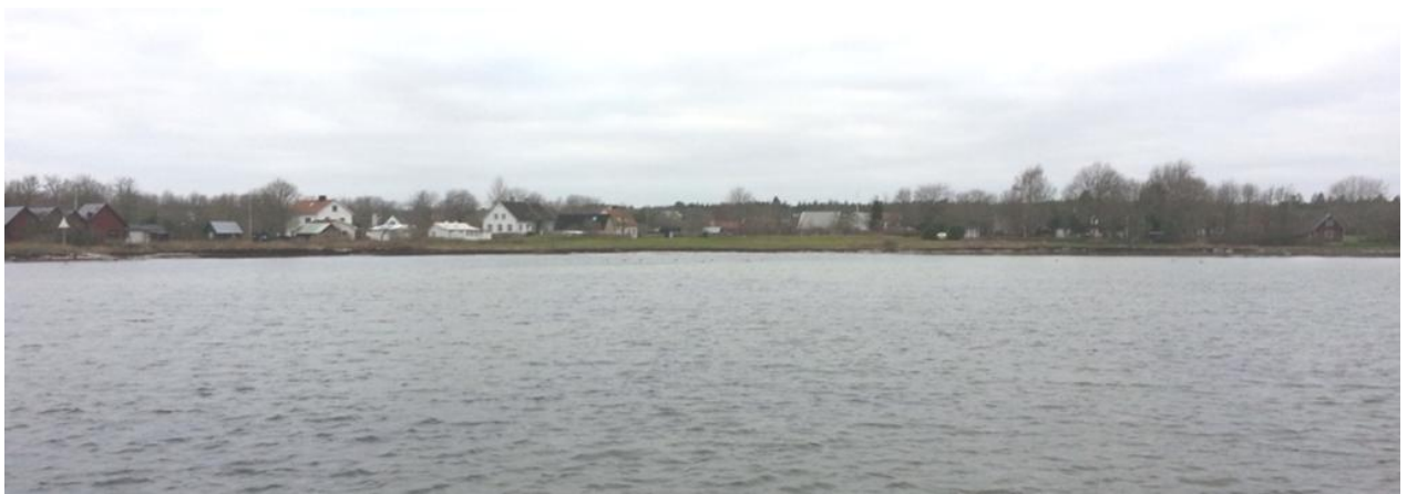
Bild: Kattviken sedd från småbåtshamnen vid Rökeriet. Om detta är en badstrand eller inte råder delade meningar om.