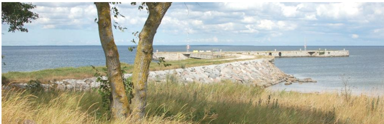
Bild: Piren mellan badplatsen och Rökeriet är en populär plats att besöka, både bland barn, unga och äldre.