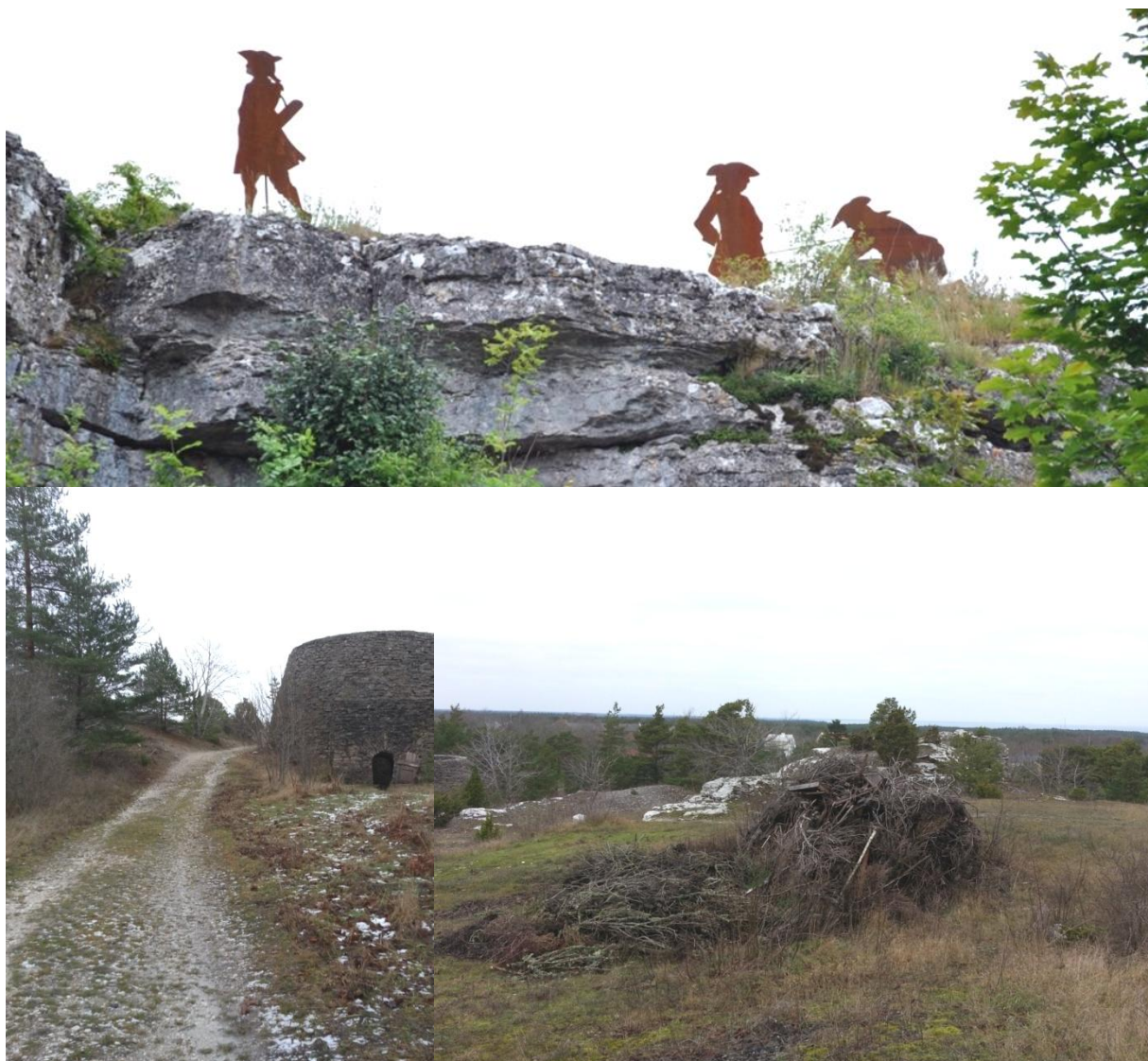
Bild: Överst – Östergarnsberget sett från Skolhuset i Östergarn. Järnsiluetterna föreställer Linné med sällskap. Nedre, vänstra – Vägen upp på Östergarnsberget mitt emot Jacob Häggs väg fungerar som pulkabacke vid snö. Här syns också en av de kulturhistoriska kalkugnarna som finns i området. Nedre högra – Den årliga majelden tänds uppe på Östergarnsberget, ovanför pulkabacken.

Sociotopvärden: Promenad, motion, ridning, skidåkning, utsikt, landform, vild natur, lugn och ro, picknick, jakt, evenemang, backåkning