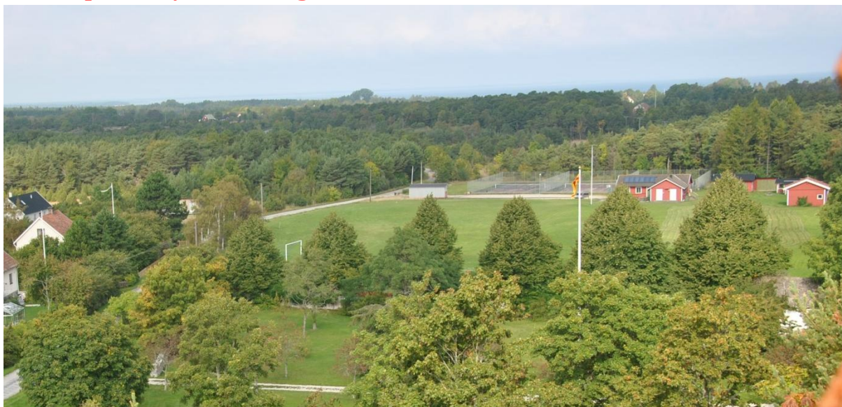
Bild: Östergårns idrottsklubbs klubbstuga och idrottsplats sedd från Östergårnsberget. I högerkant syns Östergårns prästgård där bland annat Östergårns syförening har träffar.