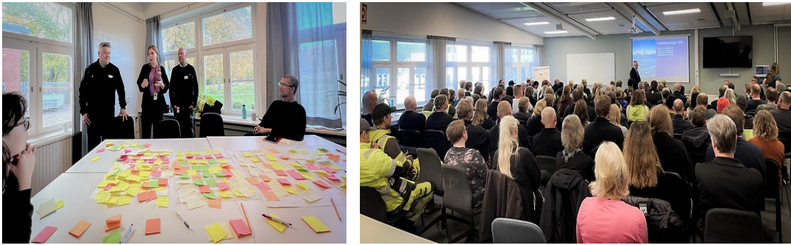
Bilder från 2023 års medarbetardialog