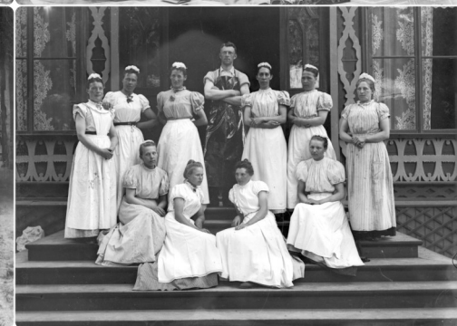
Frälsningsarméns orkester, handarbete textil, konstnärer, tjänstefolk. N.J.A. Lagergren, Visby, 1890-tal. Original på glasplåt.